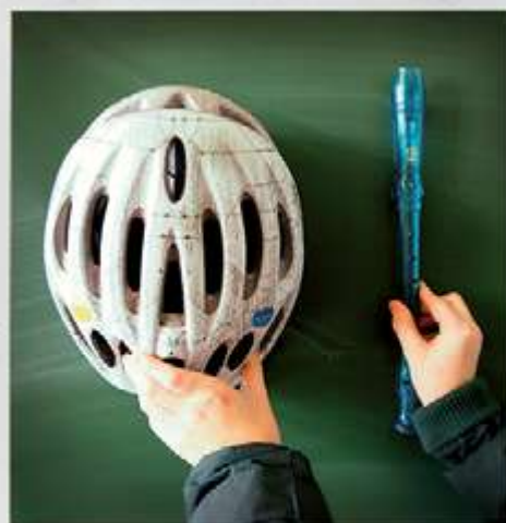
REPRÉSENTATION DU FÉMININ ET DU MASCULIN POUR UN GARÇON DE 2 de DU LYCÉE S t EXUPÉRY À MARSEILLE, EN 2014. ATELIER ÉGALITÉ GARÇON/FILLE - CIE EN RANG D'IGNONS - LE MERIAN