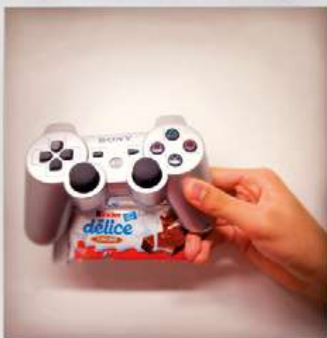
REPRÉSENTATION DU FÉMININ ET DU MASCULIN POUR UN GARÇON DE 3 e DU COLLÈGE J-C IZZO À MARSEILLE, EN 2014. ATELIER ÉGALITÉ GARÇON/FILLE - CIE EN RANG D'IGNONS - LE MERIAN