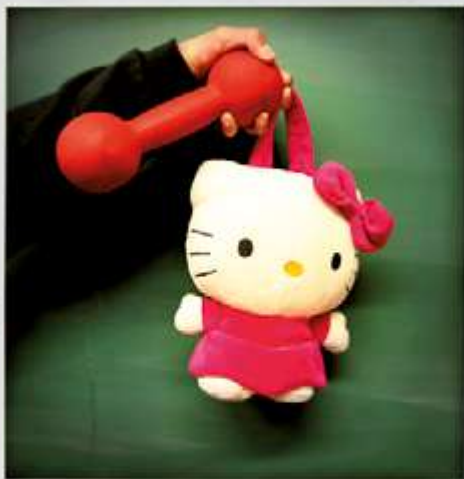
REPRÉSENTATION DU FÉMININ ET DU MASCULIN POUR UN GARÇON DE 3 e DU COLLÈGE J-C IZZO À MARSEILLE, EN 2014. ATELIER ÉGALITÉ GARÇON/FILLE - CIE EN RANG D'IGNONS - LE MERIAN