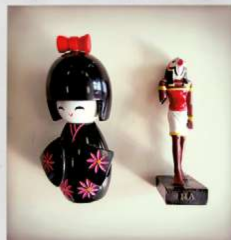
REPRÉSENTATION DU FÉMININ ET DU MASCULIN POUR UN GARÇON DE 2 de DU LYCÉE S t EXUPÉRY À MARSEILLE, EN 2014. ATELIER ÉGALITÉ GARÇON/FILLE - CIE EN RANG D'IGNONS - LE MERIAN