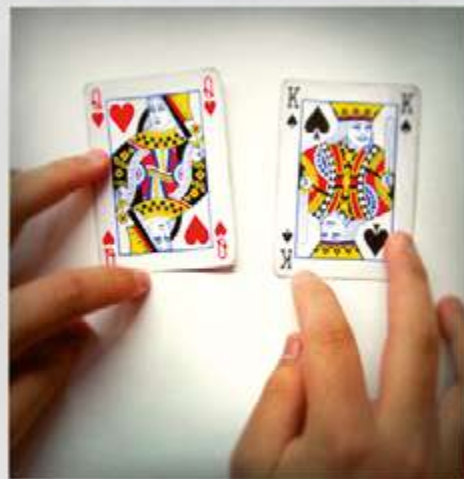
REPRÉSENTATION DU FÉMININ ET DU MASCULIN POUR UN GARÇON DE 3 e DU COLLÈGE J-C IZZO À MARSEILLE, EN 2014. ATELIER ÉGALITÉ GARÇON/FILLE - CIE EN RANG D'IGNONS - LE MERIAN