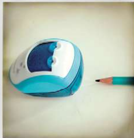
REPRÉSENTATION DU FÉMININ ET DU MASCULIN POUR UN GARÇON DE 2 de DU LYCÉE S t EXUPÉRY À MARSEILLE, EN 2014. ATELIER ÉGALITÉ GARÇON/FILLE - CIE EN RANG D'IGNONS - LE MERIAN