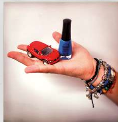
REPRÉSENTATION DU FÉMININ ET DU MASCULIN POUR UNE FILLE DE 2 de DU LYCÉE PÉRIER À MARSEILLE, EN 2014. ATELIER ÉGALITÉ GARÇON/FILLE - CIE EN RANG D'IGNONS - LE MERIAN