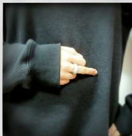
REPRÉSENTATION DU FÉMININ ET DU MASCULIN POUR UNE FILLE DE 2 de DU LYCÉE PÉRIER À MARSEILLE, EN 2014. ATELIER ÉGALITÉ GARÇON/FILLE - CIE EN RANG D'IGNONS - LE MERIAN