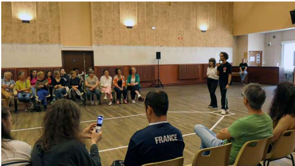
Les témoignages de violence