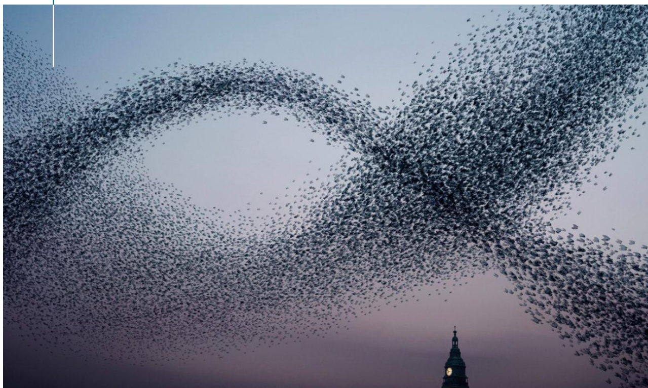
Murmurations (Alain Delorme)

Je me suis alors amusé à créer des formes de spectacles qui ne se ressemblaient pas. Des pièces courtes, des formats longs, des balades chorégraphiques, des bals participatifs... sur scène ou dans la rue, des théâtres aux jardins publics. L'œuvre est adressée à chaque fois d'une nouvelle manière et j'ose espérer que chacun, chacune y trouve son chemin.