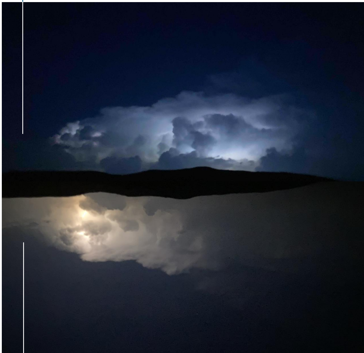
Orage d'été en Ardèche

Marie Doré – LoLink – marie@lolink.net - 06 75 57 91 32