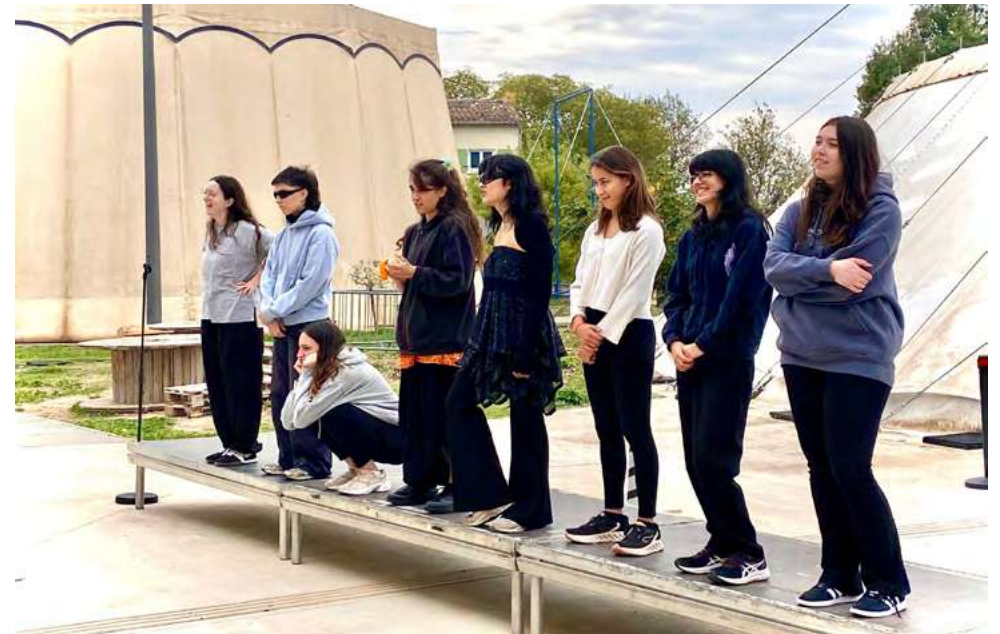
Répétitions sur le catwalk avec les amatrices - résidence au Théâtre de Grasse