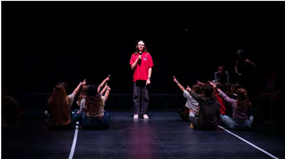
Les témoignages de violence