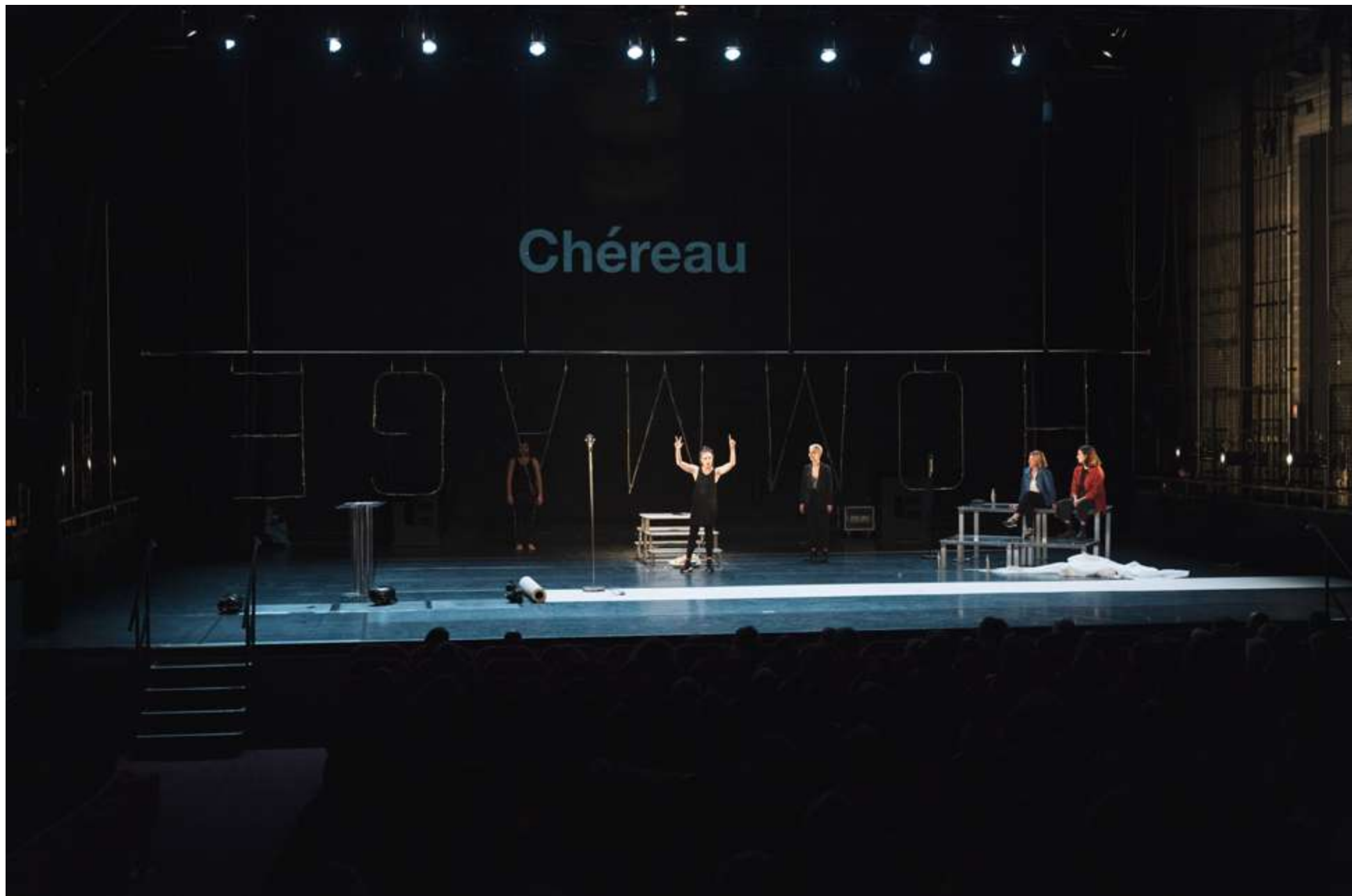
représentation au Carré Colonnes scène nationale à St Médard