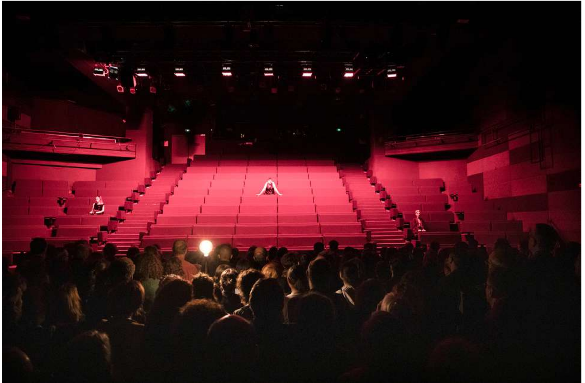
représentation au ZEF scène nationale de Marseille