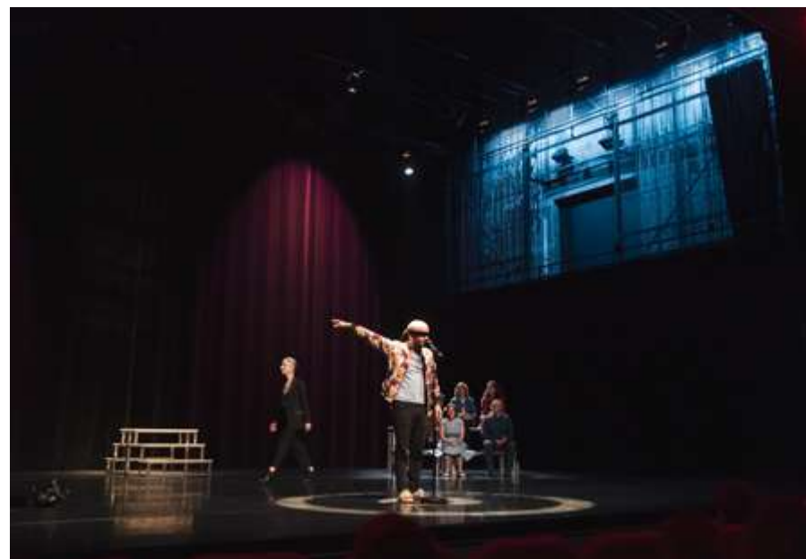
représentation au Carré Colonnes scène nationale à St Médard